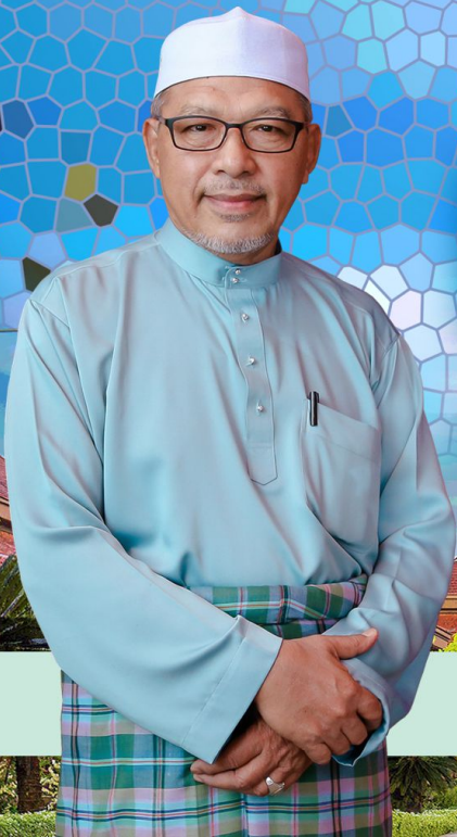
YAB USTAZ DATO' HAJI AHMAD BIN YAKOB (DATO' BENTARA KANAN)